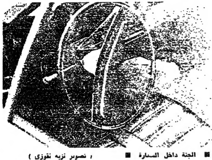
الجنة داخل السيارة